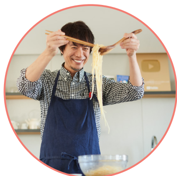
りょうりけんきゆうか 料理研究家 コウケンテツ