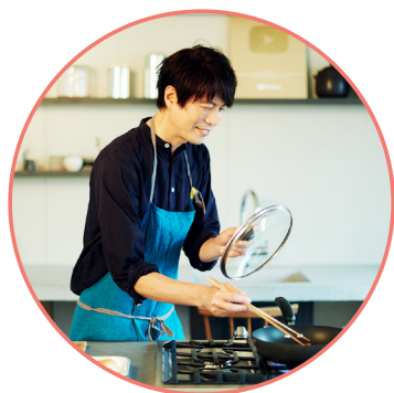
りょうりけんきゅうか 料理研究家 コウケンテツ